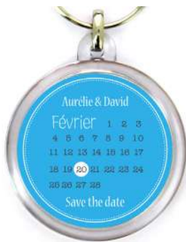
Prévisualisation sans décalage