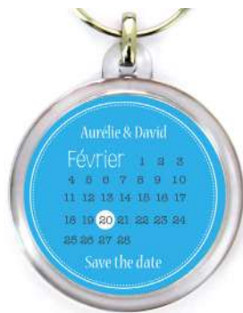
Prévisualisation avec décalage de +/-1mm

Concernant les fichiers Pdf et Ai, les calques et transparences doivent impérativement être aplatis.