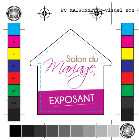
Fichier non conforme