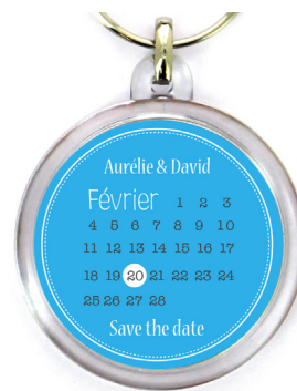
Prévisualisation avec décalage de +/-1mm

Concernant les fichiers Pdf et Ai, les calques et transparences doivent impérativement être aplatis.