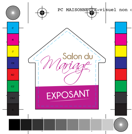
Fichier non conforme