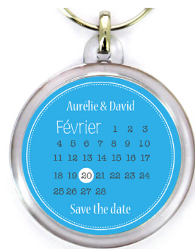
Prévisualisation avec décalage de +/-1mm

Concernant les fichiers Pdf et Ai, les calques et transparences doivent impérativement être aplatis.