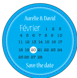
Visuel avec une bordure en pointillés

Si votre visuel est centré et comprend une fine bordure autour du bord du produit, la présence de cette bordure peut accentuer ce décalage. Voir exemple ci-dessous: