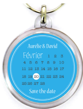
Prévisualisation sans décalage